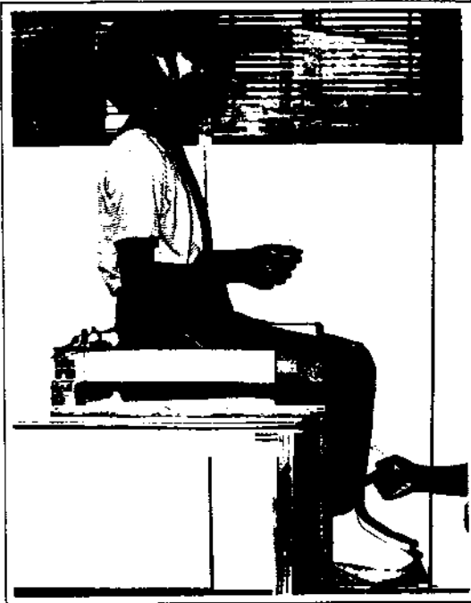
그림 1. 측정기 및 측정 자세