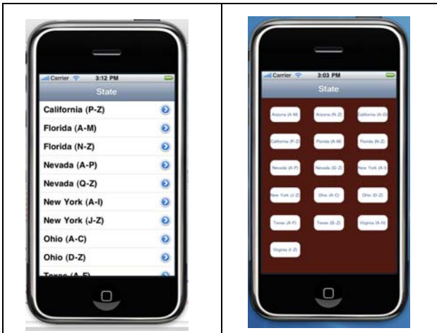
Figure 1. 1 st Menu type: Text menu (breadth=16)

현재 스마트폰에서 이용되는 2D 메뉴가 이번 실험에 이용되었다. 2D 메뉴는 스크롤이 필요없고 모든 아이템이 한 화면에 보이는 overview 메뉴와 스크롤이 필요한 text 메뉴였다 (Figure 1 and Figure 2).